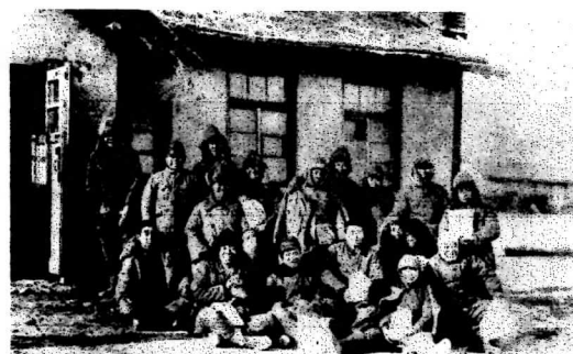
舞鶴引上記念館所蔵 満蒙開拓青少年義勇軍